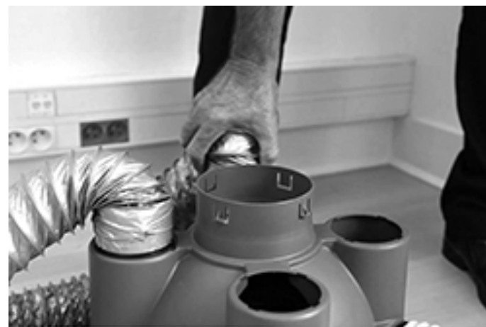
Installation de la VMC